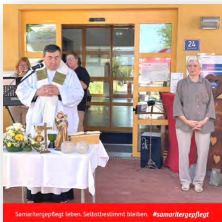
Samaritergepflegt leben. Selbstbestimmt bleiben. #samaritergepflegt

Nach der stimmungsvollen Heiligen Messe im Freien konnten unsere Bewohner:innen gemeinsam mit zahlreichen Angehörigen und Gästen den sonnigen und warmen Tag in vollen Zügen genießen.