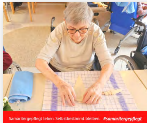
Samaritergepflegt leben. Selbstbestimmt bleiben. #samaritergepflegt

Am 19. Mai lag ein ganz besonderer Zauber in der Luft des Pflegekompetenzzentrums Strem: Der verführerische Duft frisch gebackener Salzstangerl zog durch die Gänge und zauberte allen ein Lächeln ins Gesicht. Mit viel Herzblut, Freude und vereinten Kräften haben unsere Bewohner:innen gemeinsam den Teig geknetet, geformt und mit liebevoller Sorgfalt gebacken. Jeder Handgriff war von Gemeinschaft und Lebensfreude getragen – und das Ergebnis konnte sich sehen (und schmecken!) lassen. Das warme Gebäck, außen knusprig und innen herrlich weich, war nicht nur ein kulinarisches Highlight, sondern auch ein schöner Anlass für gemeinsames Tun und gute Gespräche. Solche Aktivitäten bringen Abwechslung in den Alltag und machen einfach Freude.