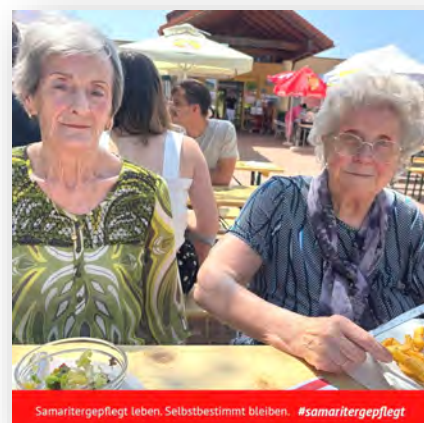
Samaritergepflegt leben. Selbstbestimmt bleiben. #samaritergepflegt

Ein musikalisches Highlight bot die stimmungsvolle Livemusik mit traditioneller burgenländischer Note, sie brachte viele zum Mitsingen, Mitwippen und Schunkeln. Ein rundum gelungener Tag voller Gemeinschaft, Musik und sommerlicher Freude!